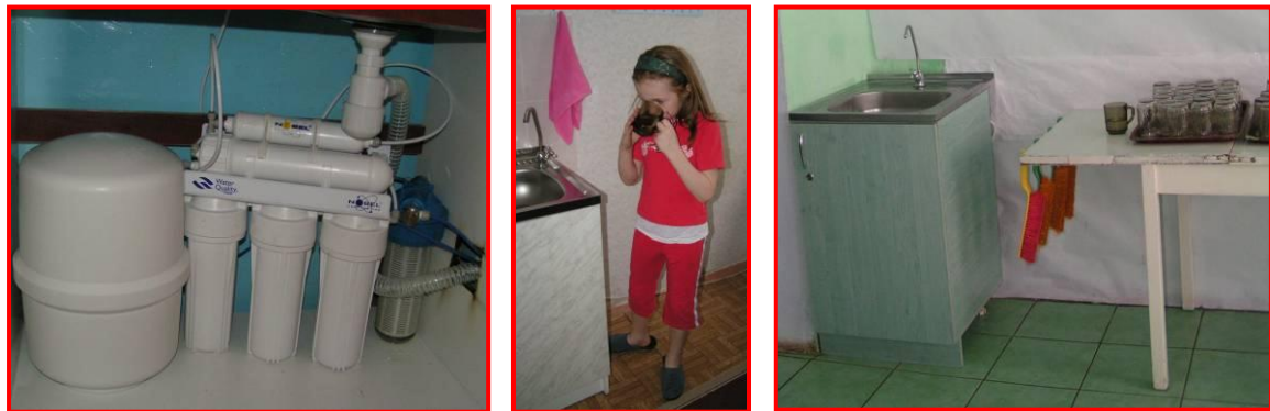
Waterfiltersysteem voor scholen

Zolang wij voor dit project donaties blijven ontvangen, zullen wij scholen in Moldavië van waterfiltersystemen blijven voorzien. Alles wordt uiteraard in het land zelf aangeschaft en onderhouden, zodat ook de plaatselijke economie wordt ondersteund.