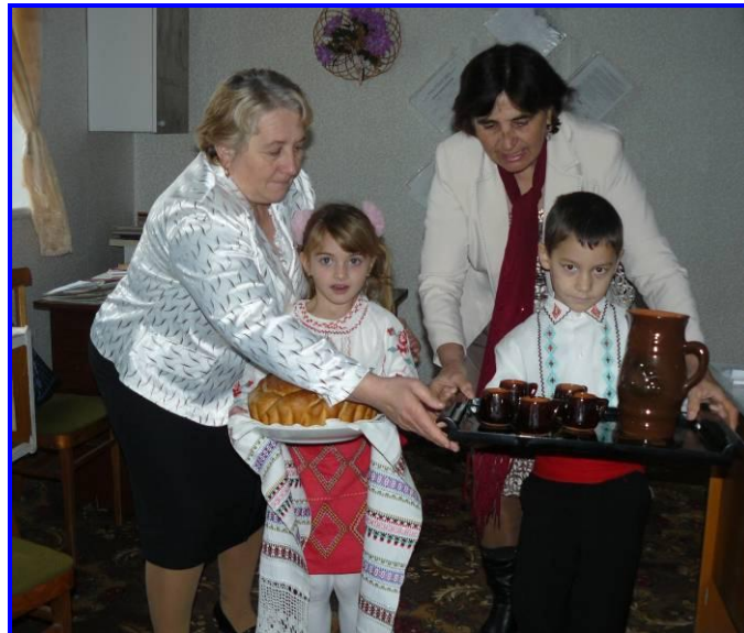
Een traditioneel welkom met brood en wijn