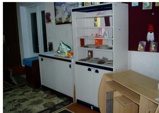
Schoolborden en meubilair uit ons transport zijn altijd zeer welkom