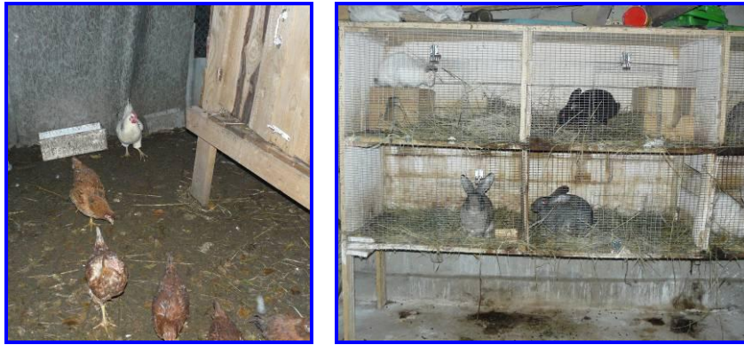
Kippen en konijnen bij diverse families en groepswoningen