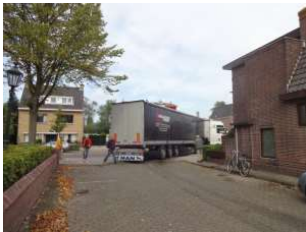
Vertrek uit Voorschoten