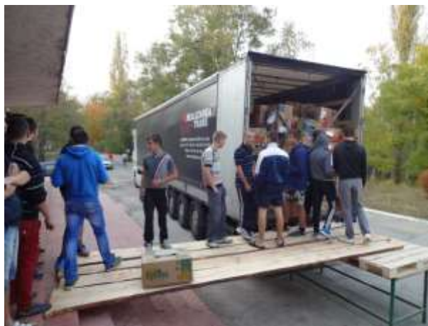
Uitladen in Chisinau

Een andere activiteit van Casa Aschiuta, hulp aan vluchtelingen, gaat wel door. In Moldavië zijn vluchtelingen uit Afghanistan en sinds kort uit Syrië en het oosten van Oekraïne. Bij de 200 Syrische vluchtelingen zijn ongeveer 60 gezinnen waarvan de vrouw oorspronkelijk uit Moldavië kwam en getrouwd is met een Syriër. Voor die vluchtelingen wil men kleding, dekens, bedden, matrassen, kinderwagens, keukenmateriaal, e.d.. Dit is een aandachtspunt voor 2015.