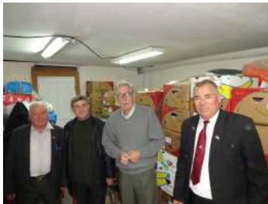
Het bestuur van de Veteranenclub in Straseni met een gedeelte van de ontvangen goederen