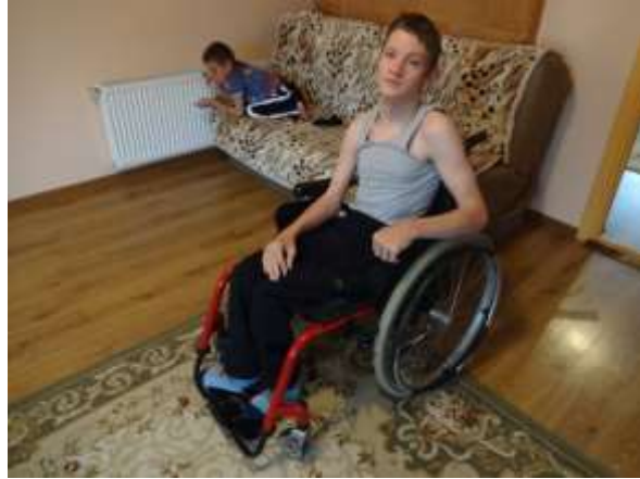
Rolstoelen voor Keystone