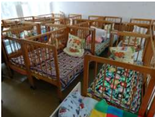
Dekentjes uit Nederland

Ook met dit transport is weer gebleken dat hulpgoederen zo hard nodig zijn in Moldavië. Het is goed te zien dat er een positieve ontwikkeling is waar te nemen in het land. Onze contactpersonen in Moldavië blijven vol goede moed om zaken te willen veranderen. Ondanks dat blijft er nog veel armoede. De oorlog in Oost-Europa is ook merkbaar in Moldavië, doordat er vluchtelingen vanuit deze gebieden binnen komen.