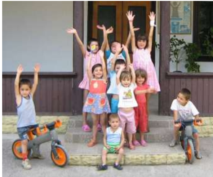
Kinderen blij met hulp uit Nederland