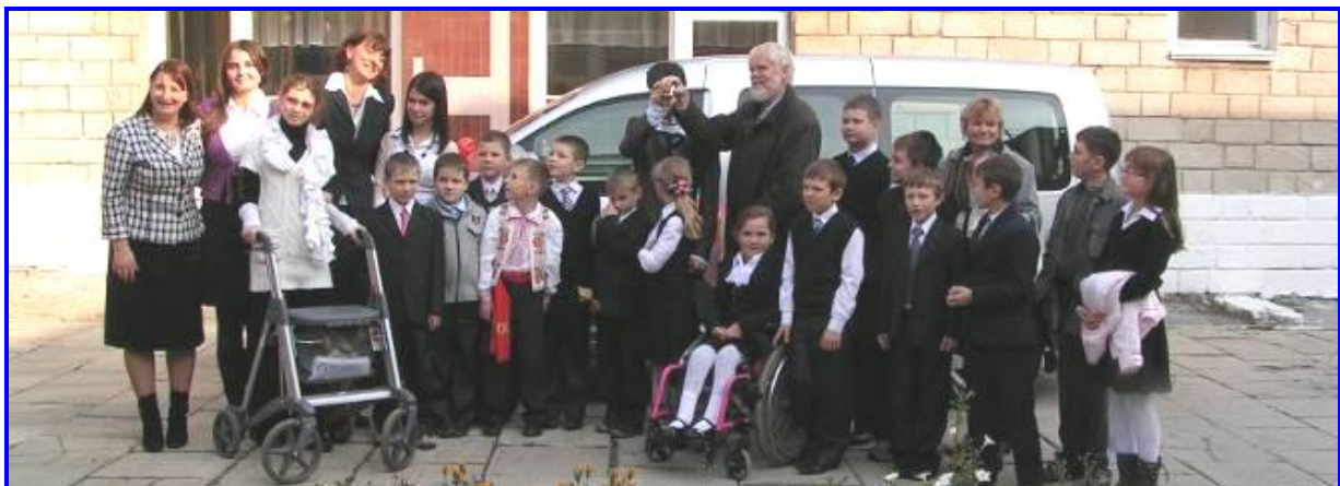
Feestelijke overdracht van de autosleutels (Alle kinderen hebben vandaag hun mooiste kleding aan!)

Op 20 oktober 2011 hebben wij deze auto - tijdens een feestelijke bijeenkomst in Moldavië - officieel aan Speranța overgedragen. In de plaatselijke krant werd hiervan melding gemaakt. Een aangepaste auto voor rolstoelvervoer is in Moldavië echt bijzonder. De Nederlandse consul was met zijn vrouw bij de feestelijkheden aanwezig, evenals de directeur van onze partnerorganisatie Step by Step.