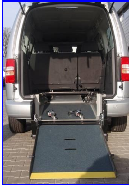
Aangepaste auto voor rolstoelvervoer

Speranța ondersteunt gezinnen met gehandicapte kinderen in Chisinau. Op het dagcentrum worden kinderen getest en hun mogelijkheden bekeken. Daarna wordt de hulpverlening gestart. Speranța organiseert ook diverse activiteiten, zoals koken, schilderen en knutselen. Iedere week is er een jongerensoos; de kinderen hebben hier veel steun aan elkaar. De organisatie Speranța zorgt tevens voor vervoer naar school en weer terug naar huis. Veel kinderen kunnen - door hun handicaps - niet met het openbaar vervoer mee en zijn hiervoor afhankelijk van Speranța. Sinds drie jaar steunen wij deze organisatie met o.a. rolstoelen, incontinentiematerialen, allerlei soorten hulpmiddelen en educatief speelgoed. Zij hebben onze steun gevraagd bij het vervoer van de kinderen in rolstoelen. Hun oude schoolbus is versleten, vaak kapot en eigenlijk niet geschikt voor rolstoelvervoer. In 2010 zijn wij gestart met het inzamelen van geld hiervoor. In 2011 hebben wij voldoende ingezameld om een nieuwe aangepaste auto voor rolstoelvervoer te kunnen aanschaffen. Deze auto is geschikt voor het vervoer van 5 personen plus 1 persoon in een rolstoel.