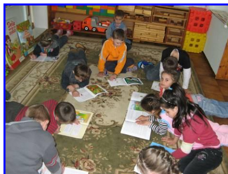
Ons boekenproject is een groot succes op de plattelandsscholen