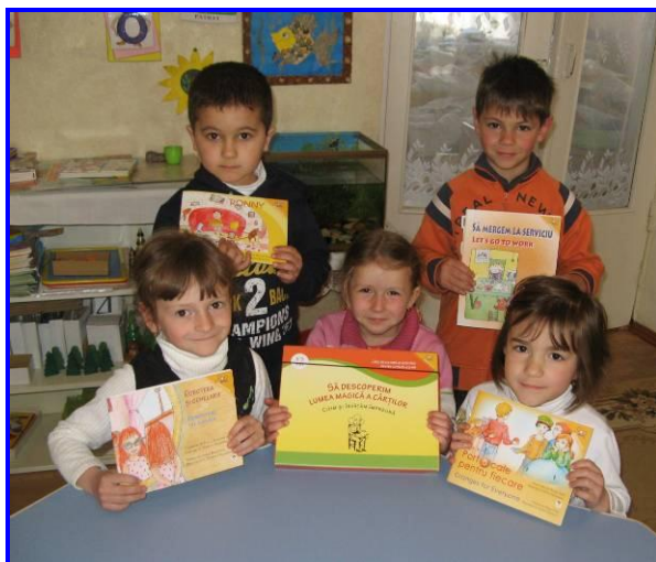
Kinderen blij met hulp uit Nederland