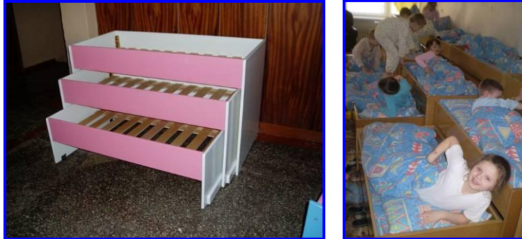
Nieuw gemaakte bedden in Moldavië

Technische School nr. 4 maakt sinds 2009 voor ons houten schuifbedden. Deze kinderbedden zijn, op verzoek van onze partnerorganisatie Step by Step, in 2007 ontworpen in Nederland (bij het ROC Leiden) en als proefmodel naar Moldavië gestuurd. In een leer/werk project heeft het ROC Leiden daarna een 9-tal sets vervaardigd. Vanaf 2009 is dit project overgenomen door de technische school voor houtbewerking in Chisinau. Wij zorgen voor de materialen en de school maakt met de leerlingen deze schuifbedden. Daarna worden de bedden verspreid over diverse kinderdagverblijven. Ook andere organisaties bestellen deze bedden nu bij de school.