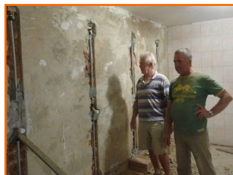
De loodgieters plaatsen alle leidingen