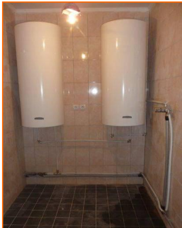
De nieuwe boilers zijn geplaatst