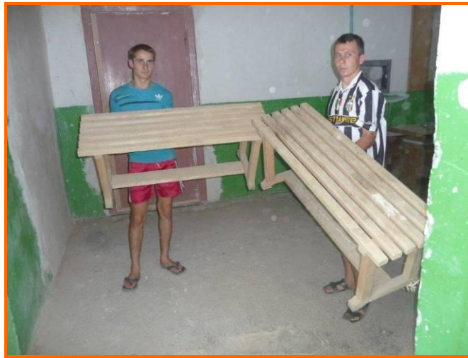
Leerlingen hebben zelf bankjes gemaakt voor de kleedruimtes