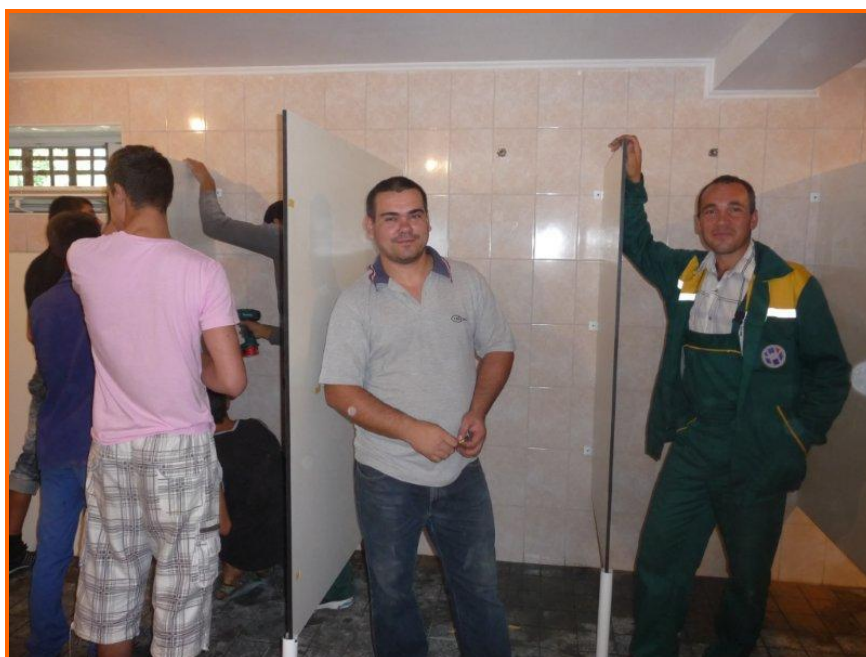
De scheidingswanden worden geplaatst

Begin dit jaar hebben we veel materialen van de Nederlandse Basisschool de Kariboe in Heemskerk gekregen. De Kariboe ging verhuizen naar een nieuwe school en alle nog bruikbare materialen hebben wij meegenomen naar Moldavië. Fijn om te zien dat de goederen daar goed gebruikt worden.