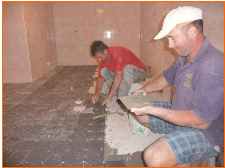
De tegelzeters werken alles af