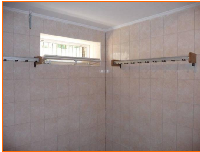
Kapstokhaken komen uit Nederland

Begin dit jaar hebben we veel materialen van de Nederlandse Basisschool de Kariboe in Heemskerk gekregen. De Kariboe ging verhuizen naar een nieuwe school en alle nog bruikbare materialen hebben wij meegenomen naar Moldavië. Fijn om te zien dat de goederen daar goed gebruikt worden.