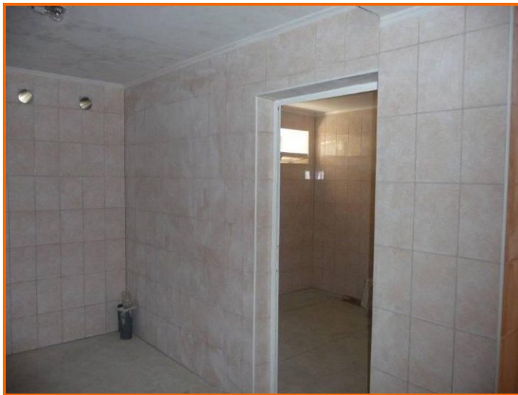
Het ziet er al geweldig mooi uit!