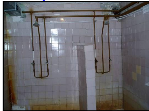
Leidingen verroest en afvoer kapot

Hulde aan allen, die een bijdrage hebben geleverd aan dit project. We houden u op de hoogte.