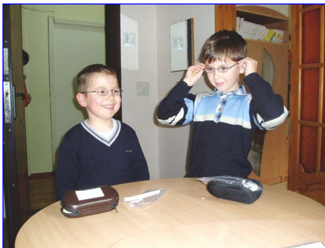
Kinderen blij met brillen uit Nederland

Daarna heb ik een bezoek gebracht aan de afdeling oogheelkunde in het Cotaga kindziekenhuis in Chisinau en gesproken met de directrice. Ook zij wil kinderen uit extreem arme gezinnen graag helpen met een bril op de juiste sterkte. Zij zal in voorkomende gevallen de gegevens van deze kinderen aan ons e-mailen, waarna onze opticiens dan een passende bril kunnen maken en opsturen. Met deze oplossing is ze dolgelukkig!