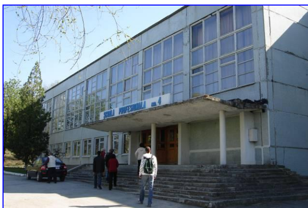
Aankomst bij de technische school in Chisinau