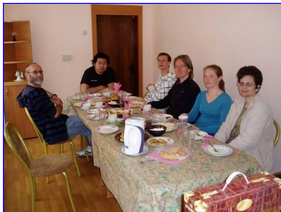
Maaltijden werden verzorgd door de school