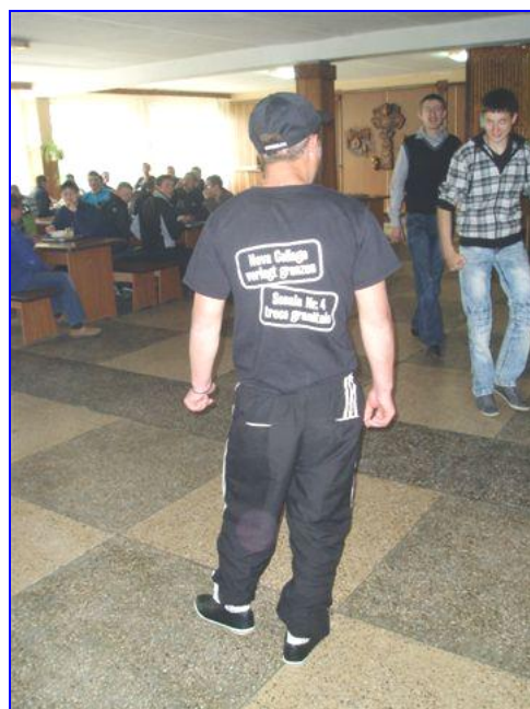
De verloting van de T-shirts