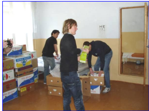
In de ziekenboeg van de school werden de computers uitgepakt, gecontroleerd en van wireless kaartjes voorzien.

Twee lokalen waren al ingericht als computerlokaal en er was een ruimte vrijgemaakt voor een internetcafé.