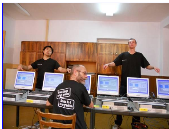
Het begint wat te worden!

In het internetcafé moesten nog stopcontacten aangelegd worden. Dat werd door het onderhoudspersoneel uitgevoerd, die ook de gaten in de muur boorden voor de netwerkkabels. Voor de ramen van het internetcafé werd ook nog een traliewerk in elkaar gelast en gemonteerd.