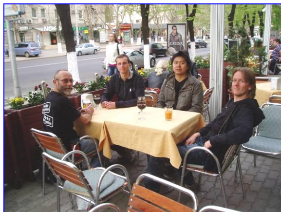
Een terrasje in Chisinau