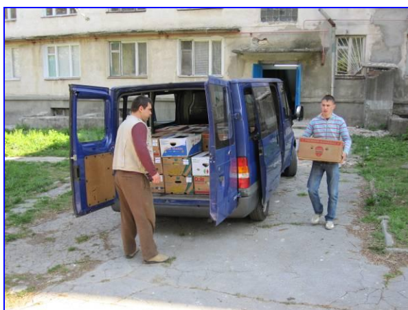
Leerlingen van de school helpen mee

Na een lange voorbereiding was het dan eindelijk zover, de installatie van het computernetwerk kon beginnen. De eerste werkdag startte meteen op maandag tweede paasdag. 's Morgens vroeg werden de computers, monitoren, servers, e.d. vanuit de kelder naar de ziekenboeg in de school gebracht.