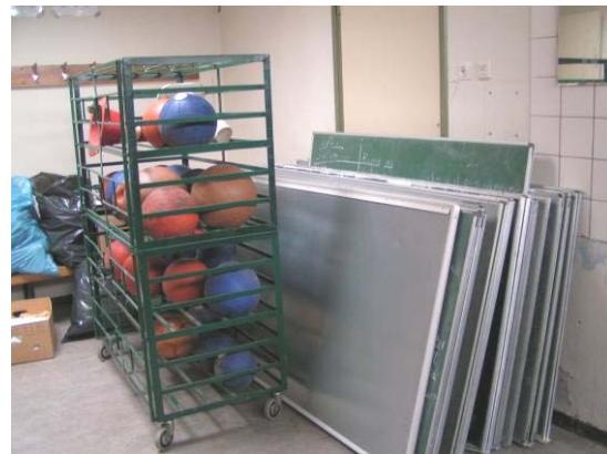
Het transport staat klaar

In Moldavië hebben we dit jaar veel hulp gekregen van scholieren, die met veel plezier alles ter plekke hebben uitgeladen. De verspreiding van de goederen is van te voren vastgelegd en alle scholen komen een keer aan de beurt. Zo bouwen we een goed contact op in het land en durven scholen ook te vragen om de hulp die ze nodig hebben.