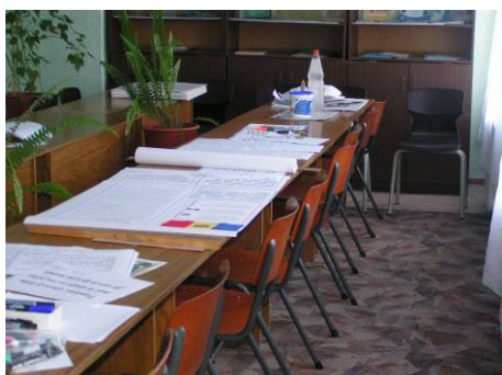
Nieuwe stoelen uit Nederland

Met eigen ogen kunnen we aanschouwen, hoe hard deze schoolmeubelen nodig zijn. Het bestaande meubilair is meestal tot op de draad toe versleten. Toch wordt alles iedere keer weer opgelapt, want geld voor nieuw meubilair is er gewoon niet!