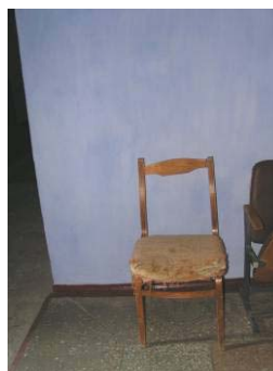
oude versleten stoel

Buiten de inrichting van de scholen zijn ook boeken een punt van onze aandacht. Er liggen al een aantal jaren nieuwe sets boeken klaar om gedrukt te worden, maar een budget hiervoor ontbreekt.