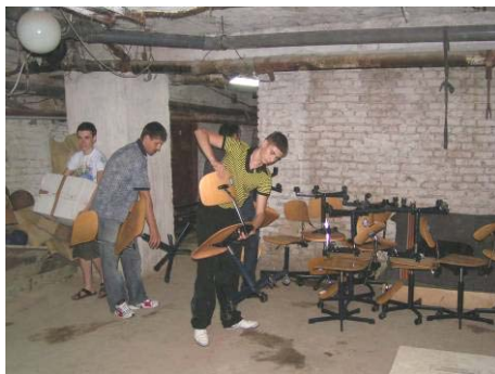
Leerlingen helpen met uitladen

In Moldavië hebben we dit jaar veel hulp gekregen van scholieren, die met veel plezier alles ter plekke hebben uitgeladen. De verspreiding van de goederen is van te voren vastgelegd en alle scholen komen een keer aan de beurt. Zo bouwen we een goed contact op in het land en durven scholen ook te vragen om de hulp die ze nodig hebben.