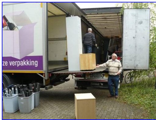
Het gebruik van de laadklep