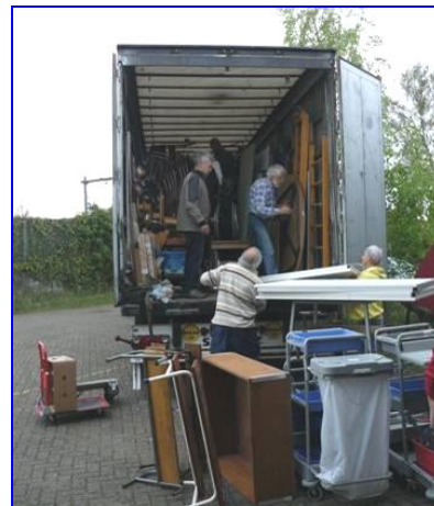
Passen en meten om alles er goed in te krijgen

Wat waren we blij toen alles er eindelijk in zat en de truck klaar was voor vertrek. Het transport duurt 4 dagen en dan kan het uitladen en distribueren in Moldavië beginnen.