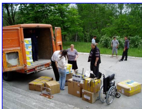
Computers voor Professional School in Dubossary, Transnistrië