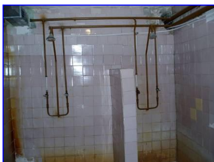
Oude kapotte douches

Onze voorzitter Henk van Veldhoven bracht samen met bouwkundig ingenieur Jan Mommers, eind maart/begin april een bezoek aan technische school nr. 4 in Chisinau. In de woongebouwen zijn de toiletten in 2010/2011 reeds vernieuwd, maar de douches moeten nog worden aangepakt. Deze zijn al 15 jaar lang niet meer te gebruiken; een armzalige toestand voor de 300 leerlingen die daar wonen.