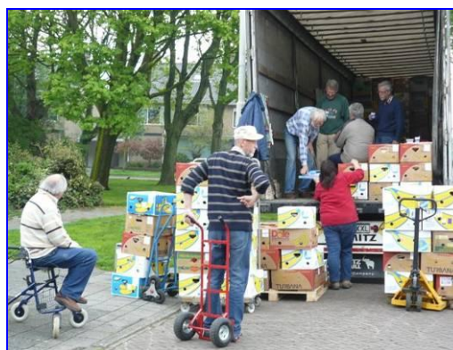
Het laden van de computers

Als kleine organisatie hebben wij geen apparatuur tot onze beschikking om zware dingen te tillen en over het algemeen doen we alles met de hand. Gelukkig hebben we dit keer van Transportbedrijf Jan Keezer uit Oostzaan een vrachtauto met laadklep te leen gekregen. Via de laadklep van deze vrachtauto konden alle zware goederen de truck worden ingebracht. Dit maakte het laden veel gemakkelijker.