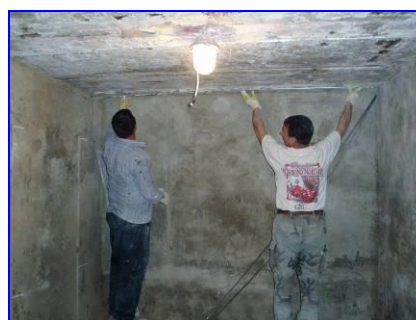
werkzaamheden mei 2012