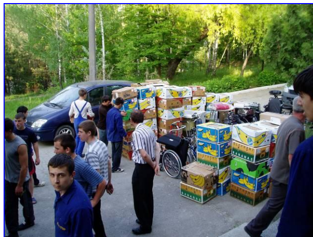
Het uitladen door leerlingen in Moldavië

Dertig leerlingen hebben zich aangemeld om mee te helpen bij het uitladen. De meeste goederen moeten naar de eerste etage worden gebracht en dat is een heel gesleep. Aan het eind van de avond zijn ze allemaal doodmoe.