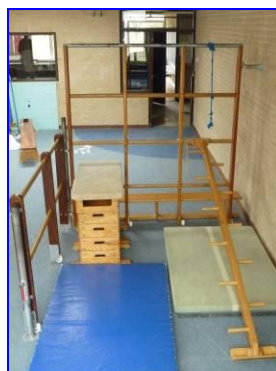
Distributie van schoolmeubilair en gymmaterialen voor Step by Step basisscholen

De bedankjes voor deze mooie goederen komen bij het secretariaat al binnen en in een latere fase zullen wij ook foto's ontvangen van de verdere distributie. Wij houden u op de hoogte.