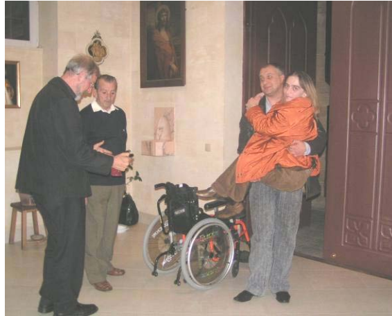
Het krijgen van een rolstoel verandert een leven ingrijpend!