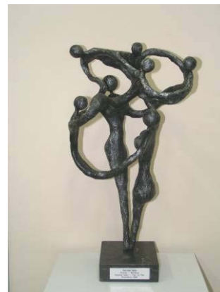
Samen dragen wij de kinderen naar een betere toekomst!