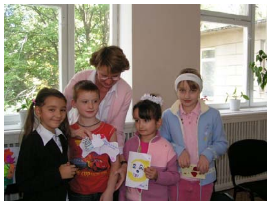
De gemaakte tekeningen, als dank