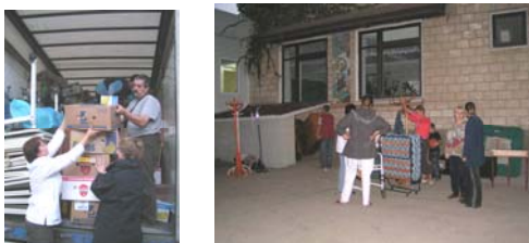
Vele handen maken licht werk

Hierna vertrekken wij naar school 152, waar aan het eind van de dag onze vrachtwagen zal worden uitgeladen. Om zes uur krijgen we bericht dat de vrachtwagenchauffeur klaar is bij de douane en dat het uitladen van de truck eindelijk kan beginnen.