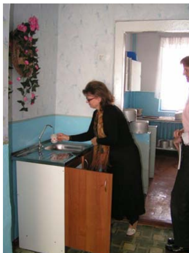
gewoon in een kastje