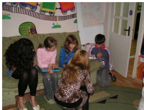
Het betreft hier kinderen uit alle lagen van de bevolking.

Geprobeerd wordt voor deze kinderen goede oplossingen te vinden en te helpen d.m.v. verschillende therapieën. Hiervoor hebben zij o.a. speelgoed nodig. Ook ondersteunen zij gezinnen, die het financieel heel moeilijk hebben, met kleding en sanitaire artikelen. Vanuit ons transport is er een pakket samengesteld wat zij hiervoor kunnen gebruiken.