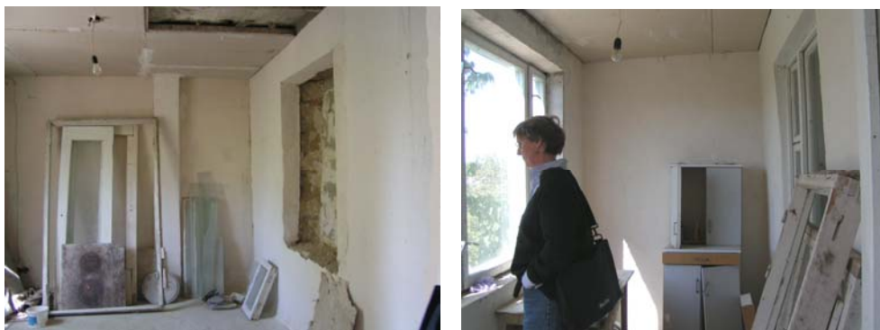
We hopen donateurs te vinden om hierbij te helpen.

In de middag bezoeken wij een kleinschalig verpleeghuis voor ouderen, dat nog in aanbouw is. Er is op dit moment helaas niet genoeg geld om het af te bouwen. De waterleiding en het sanitair moeten nog worden aangelegd. Zonder dat, kunnen hulpbehoevende mensen hier zeker niet wonen. De betreffende ouderen zullen deze winter met hulp van hun familie thuis moeten blijven, ook al zijn sommigen daar eigenlijk niet meer toe in staat. De meegebrachte inrichting voor dit huis blijft voorlopig in de opslag van de school staan.