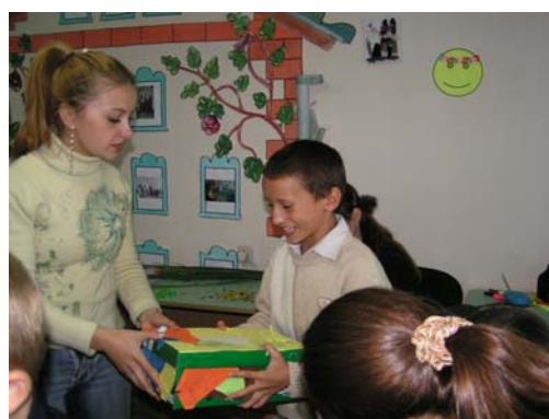
Als een schat werd het in ontvangst genomen en bekeken.