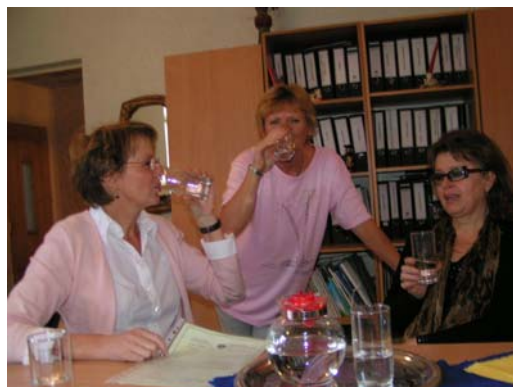
Het eerste schone water

Daarna bezoeken we de plaats waar het filter is ingebouwd in een kastje. Het is een eenvoudige oplossing, waardoor de kinderen nu iedere dag schoon water kunnen drinken. Er worden lege flesjes van huis meegenomen en die worden dan op school gevuld. In de klas hebben ze dan hun eigen flesje drinkwater bij zich.