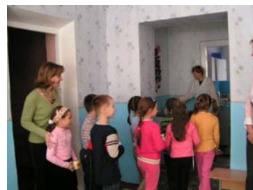
de kinderen komen flesjes vullen

De kinderen waren zo blij, dat ze mooie tekeningen voor ons hebben gemaakt. Ook de docenten kwamen bij elkaar om ons te bedanken voor dit fantastische cadeau. In het Engels was een mooie bedankbrief voor ons gemaakt. Het was hartverwarmend.