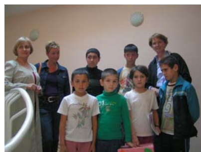
Opvanghuis voor straatkinderen