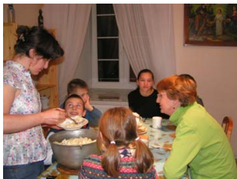
Een maaltijd samen met de kinderen

We krijgen een slaapplek toegewezen in het nieuw aangebouwde dagopvangcentrum. Overdag worden hier allerlei activiteiten georganiseerd, o.a. voor de buurtkinderen. Tevens wordt dit centrum gebruikt voor het opleiden van nieuwe medewerkers (vrijwilligers). Jongeren - uit heel Europa - die mee willen helpen in de kindertehuizen of in de kinderdorpen kunnen zich aanmelden bij de Oostenrijkse organisatie. Voor informatie: www.casaconcordia.co.at Je verbindt je minimaal 1 jaar aan de organisatie om te helpen!