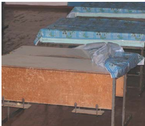
In de kantine staan oude kapotte tafels zonder stoelen. De kinderen eten daar staand of zittend op de grond.

De gymtoestellen zijn te groot en zullen met een apart transport worden geregeld. We worden ontvangen door de directrice van de school en krijgen opnieuw een rondleiding in de middelbare school, waarbij alle problemen nog eens worden doorgesproken. Het computerlokaal is nog dezelfde ramp als vorig jaar, evenals de keuken en de kantine. Hiervoor moet echt een plan van aanpak worden gemaakt. De keuken moet eerst worden opgeknapt, waarna alle defecten apparaten vervangen zouden moeten worden.