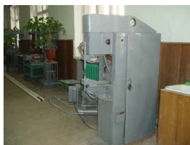
Technische school met verouderde materialen