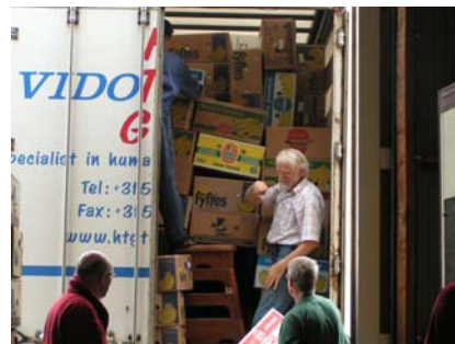
Ieder plekje wordt benut

Het is zwaar werk, maar we weten waar we het voor doen. Om 14.00 uur is alles klaar en kunnen de chauffeurs vertrekken. Ze zullen er ruim 4 dagen over doen om Moldavië te bereiken.