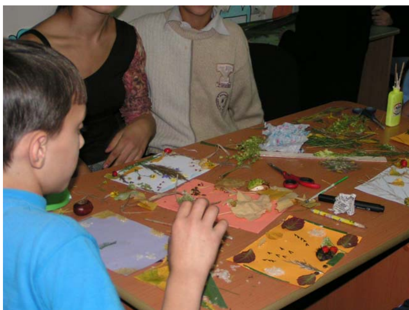
Als dank werden er herfststukjes gemaakt voor de kinderen in Nederland!

Een mooiere afsluiting van onze week hadden we niet kunnen bedenken.