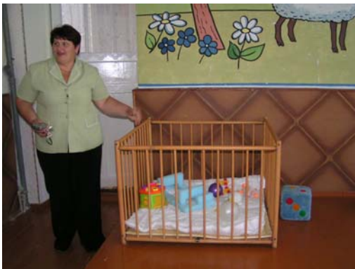
Deze box kregen zij o.a uit ons transport in 2006