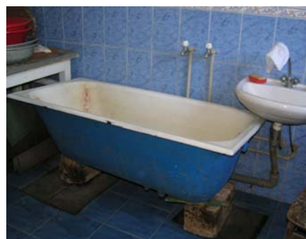
spoelen gebeurt met de hand

Veel kleine kinderen slapen overdag in dit centrum, waardoor er vooral veel was is van beddengoed. Wij kunnen ons voorstellen hoeveel werk dat is met deze apparatuur.