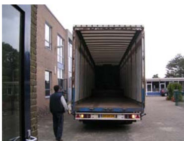
Het laden kan beginnen