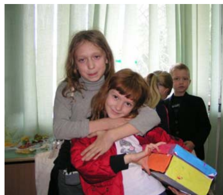
Ze ontdekten dat er ook nog foto's in de schriften zaten van de makers van de doos. Dit vonden ze geweldig en het maakte het allemaal heel persoonlijk.