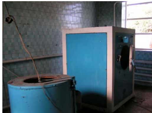
Een zeer onveilige situatie

In de school kan een lokaal worden ingericht als wasruimte, maar de vloer moet eerst worden verstevigd om deze zware wasmachine te kunnen dragen en ook de leidingen moeten worden aangepast. Dit kost 2000 euro en wordt dan door hun eigen mensen uitgevoerd. Het is 1 maand werk om dit af te maken en dan zou de wasmachine kunnen worden overgebracht. We zullen proberen hier donateurs voor te vinden.