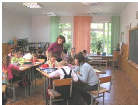
Deze begeleidsters worden vanuit een stichting beschikbaar gesteld.

Op dit moment gaat het hier om 4 kinderen, die op deze speciale manier onderwijs krijgen. De school ontvangt hiervoor van de staat geen extra financiële middelen en moet zelf zien rond te komen. Dit lukt moeilijk, maar met de hulp van ouders komen ze er gelukkig wel uit. Vaak doen ouders ook de klusjes in de school. Afgelopen jaar is het dak gerepareerd en een probleem met de verwarming verholpen.