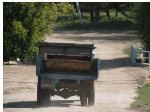
Het vervoer in het dorp