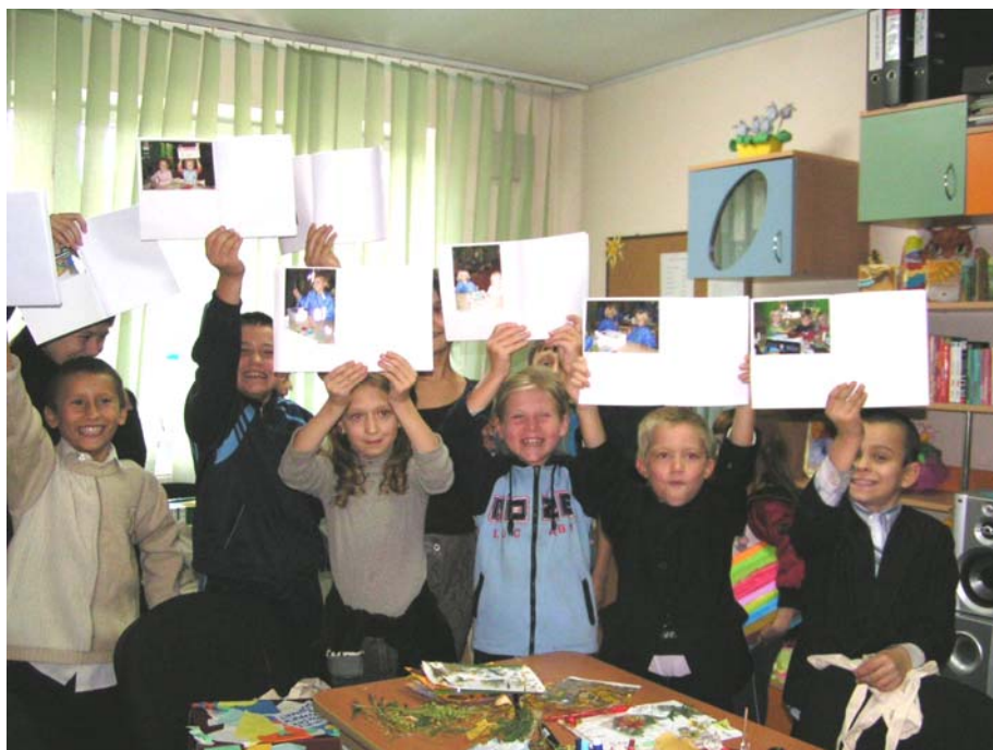
Nog nooit hebben we kinderen zo blij gezien, met zo'n eenvoudig cadeau!